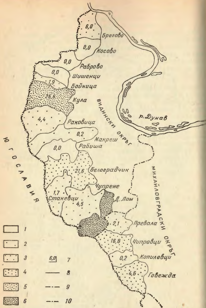
ПРИЛОЖЕНИЕ II. Разпределение на промишлената продукция на лице от населението и индекса на концентрация в крайграничната територия на Северозападна България със СФРЮ за 1972 г.

1 — общини без промишлена продукция; 2 — от 0 до 500 лв. промишлена продукция на лице от населението; 3 — от 500 до 1000 лв. 4 — от 1000 до 1500 лв. 5 — от 1500 до 2000 лв. 6 — от 2000 до 2500 лв. 7 — индекс на концентрация по общини; 8 — общинска граница; 9 — окръжна граница; 10 — държавна граница