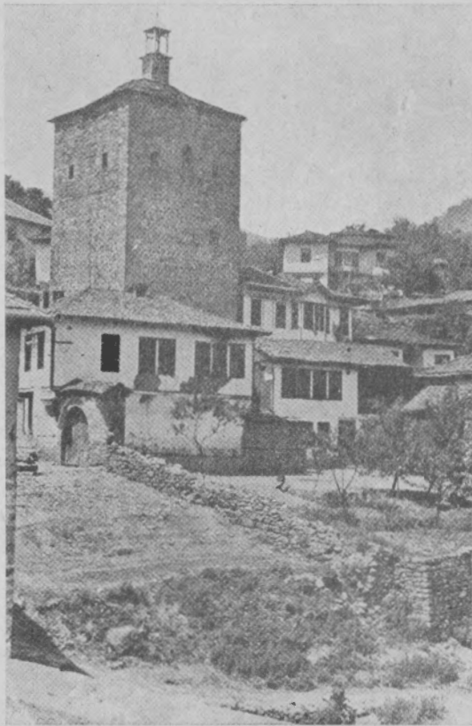
Обр. 4. Градъ Кратово. 1. Сръдновѣковна кула, 2. Училището съ двора. (Cratovo. 1. La tour médiévale, 2. L'école bulgare).