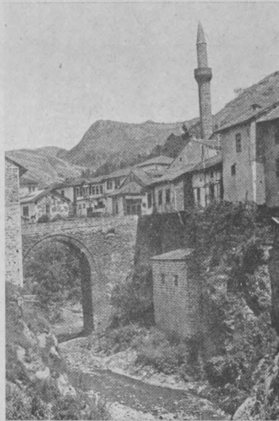
Обр. 5. Градъ Кратово. Стариненъ мостъ и типични крайрѣчни кжщи. (Cratovo. Pont ancien et maisons côtières).