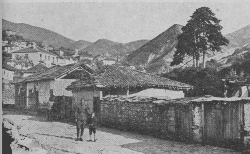
Обр. 2. Градъ Кратово и неговата околност (La ville de Cratovo entre les buttes volcaniques).