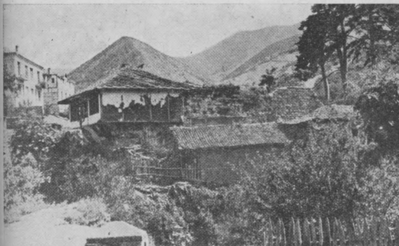
Обр. 3. Градъ Кратово. Развалини отъ сръдновѣковна кула и стари полу-разрушени кѣщи. (Cratovo. Ruines d'une tour médiévale).